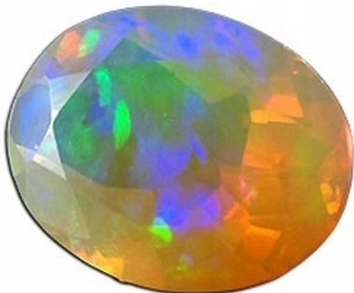
OPAL NATURALNY - 2.25 CT - APRILLAGEM_PL - AOP377